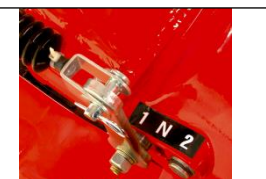
КПП в чугунном корпусе с сапуном