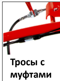
Тросы с муфтами