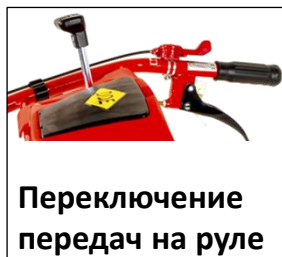
Переключение передат на руле