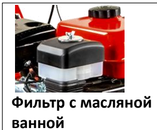
Фильтр с масляной ванной