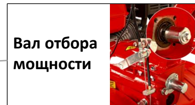
Вал отбора мощности