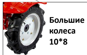
Большие колеса 10*8