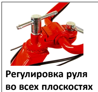
Регулировка руля во всех плоскостях