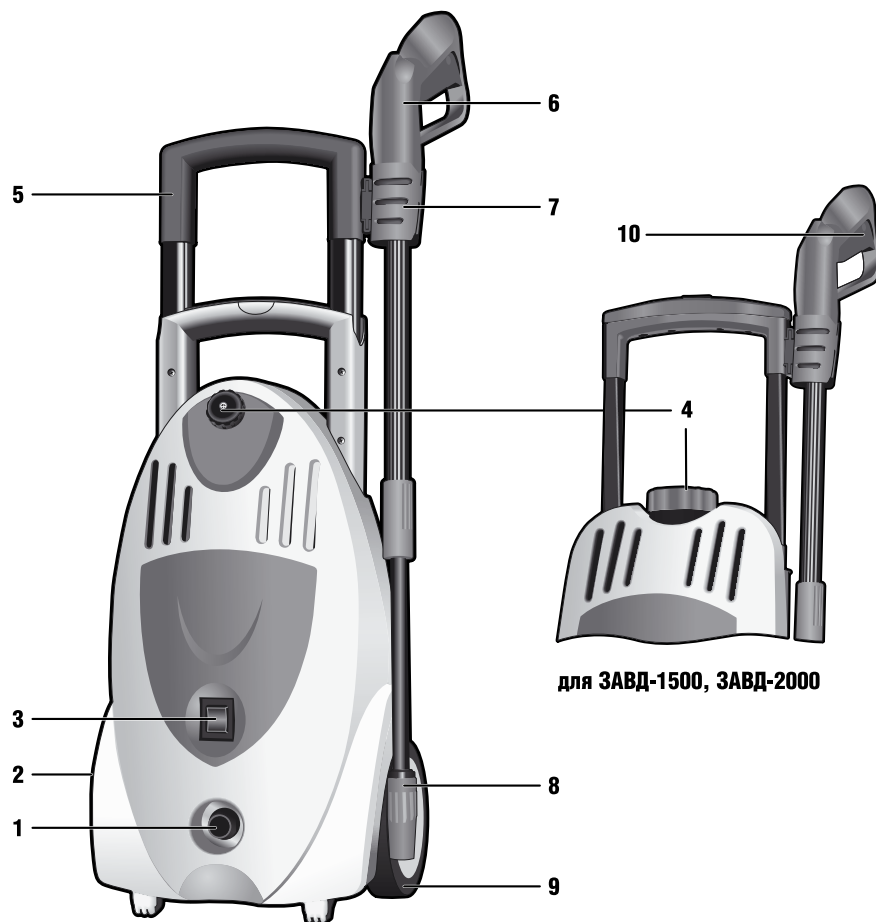
для ЗВД-1500, ЗВД-2000