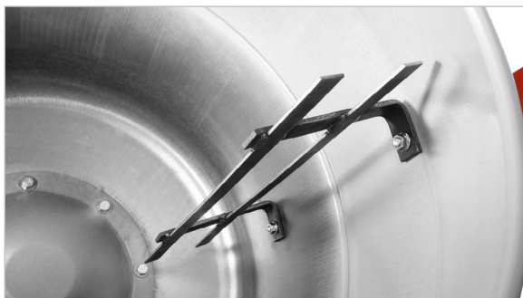
Лопасты закреплены к корпусу болтами